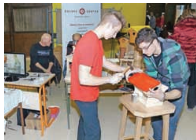
Srednješolci iz škofjeloškega tehničnega centra so prikazali znanje oblikovanja lesa.