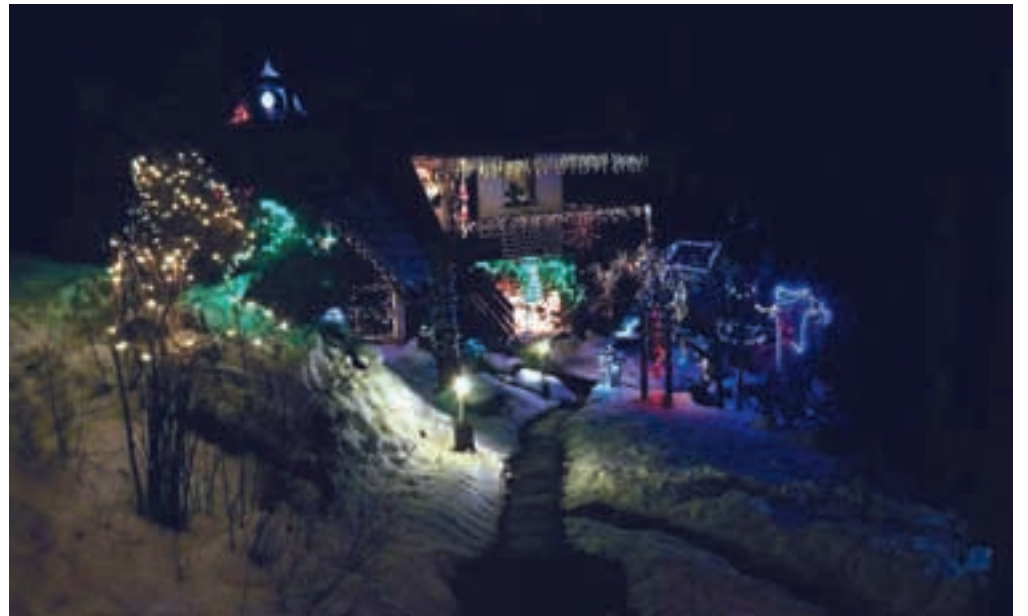
Pravljíčna deželá pri Katniku v Plavškem Rovtu

GEN-I že 5 let najcenejši dobavitelj električne energije v Sloveniji.