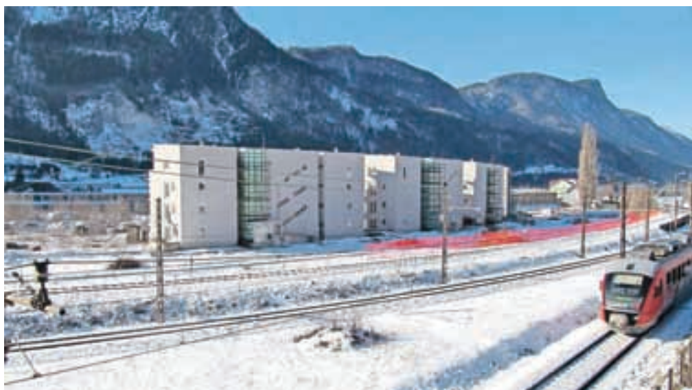
Nedokončani bloki v Hrenovci so zdaj dobili ime Gorenjski sonček. Stanovanja naj bi bila vseljiva v drugi polovici letošnjega leta.