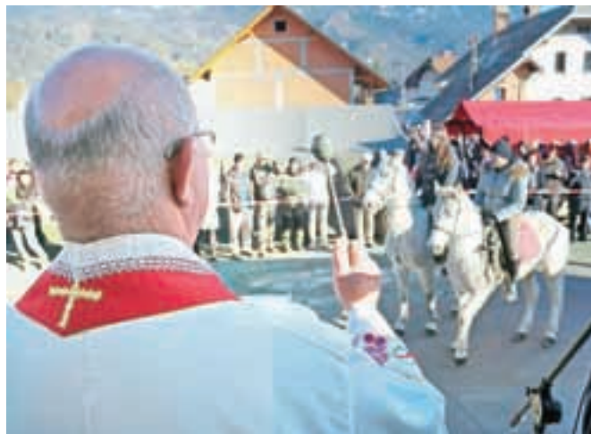
Pester december na Blejski Dobravi je dosegel vrhunec z blagoslovom konj na štefanovo, 26. decembra.