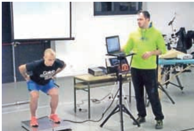
Na seminarju so bili predstavljeni tudi pripomočki za ugotavljanje stanja športnika.

nosti, predstavil je preventivno načrtovanje treninga in vzroke za nastanek poškodb. "Pripomočki za ugotavljanje stanja športnika, kot so Tmg – tenziomiografija, bilateralne pritiskovne plošče in fotocelice, ki so bili predstavljeni na seminarju, nam pomagajo lažje razumeti probleme, s katerimi se pri športni vadbi vsakodnevno srečujemo. V prihodnosti načrtujemo organizacijo novega seminarja, na katerem bi bile praktično predstavljene različne metode razvoja sposobnosti športnikov," je povedal Primož Samar.