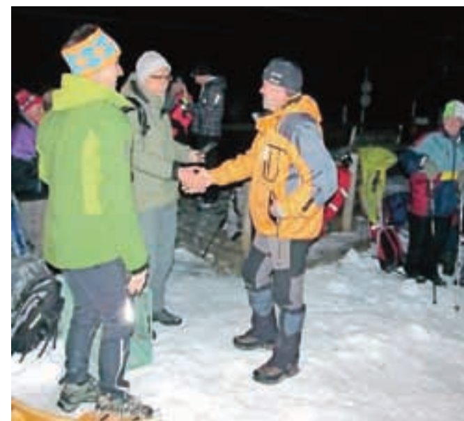
Podelitev priznanj na pohodu ob polni luni