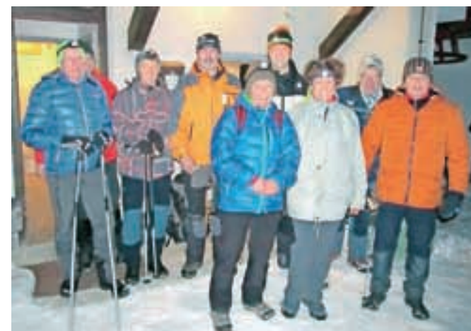
Pohodniki z največ vzponi

Prednost našega kabela priključka je brezplačna instalacija v stanovanju, novi televizijski sprejemniki ne potrebujejo zunanjih vmesnikov in naprav ter dvojnih daljinskih upravljalnikov, za starejše televizijske sprejemnike zunanji digitalni sprejemnik po ugodni ceni, za osnovno ceno prikljop do treh televizijskih sprejemnikov, hiter servis in odprava napak ter podpora pri nastavitvah televizijskih sprejemnikov in mrežnih naprav.