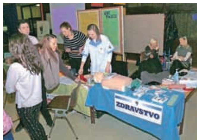
Na poklicnem sejmu se je predstavila tudi Srednja šola Jesenice.

ti pri tej odločitvi, saj se bodo tako do informativnega dne lažje odločili, katero šolo si bodo ogledali, da podrobneje vidijo, kaj posamezne šole ponujajo, kar je zagotovo koristno pri odločitvi za nadaljevanje šolanja.«